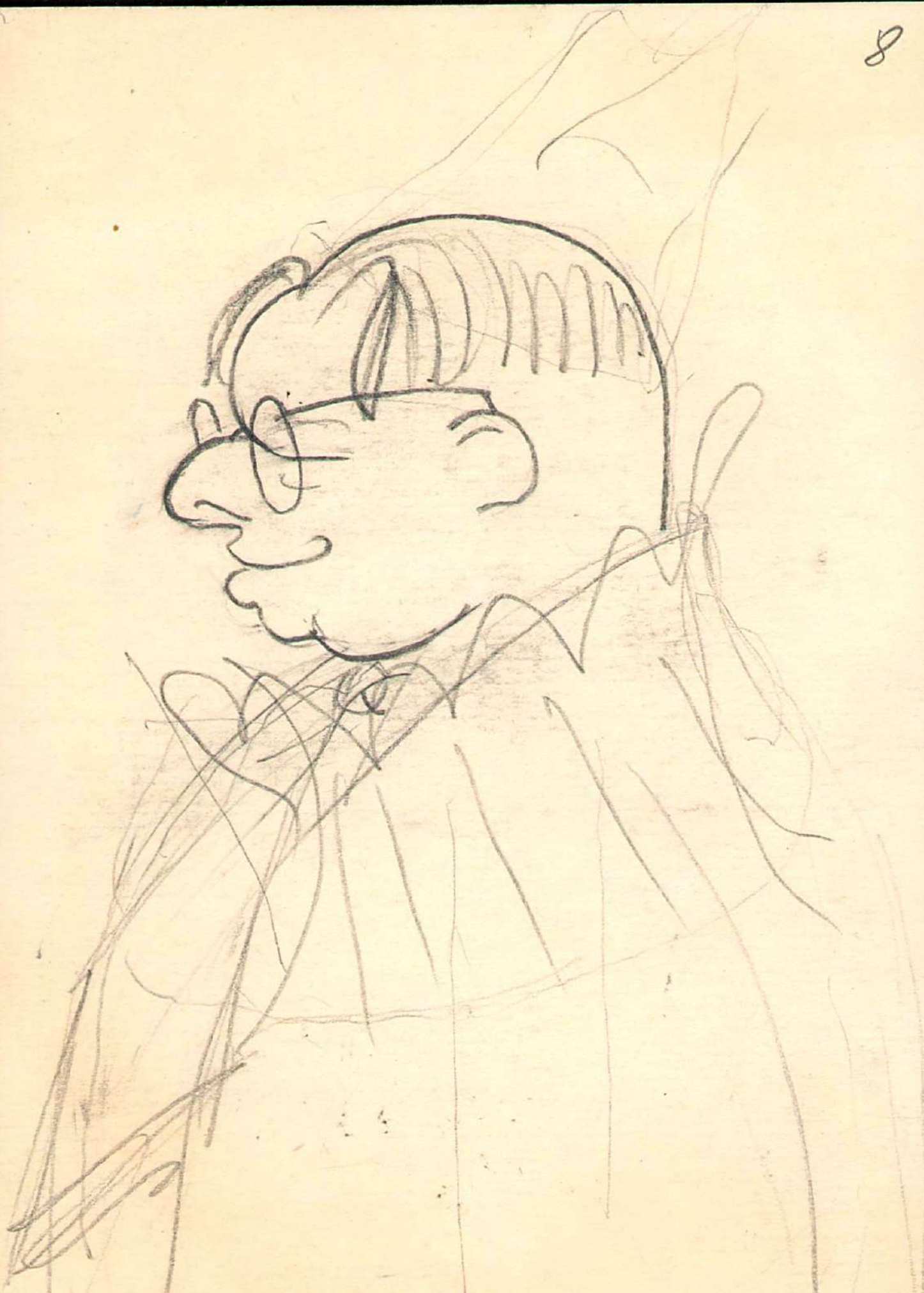
Писменник Синь Сурин Михайл Скрыпка